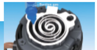
構造解説用3Dアニメーション